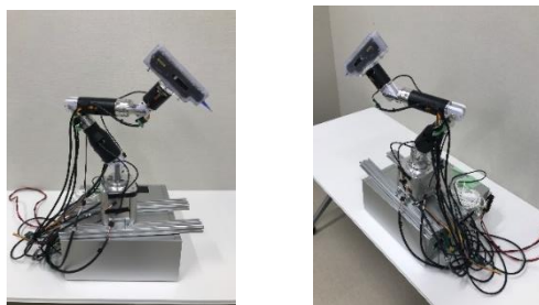
開発中のロボットアーム